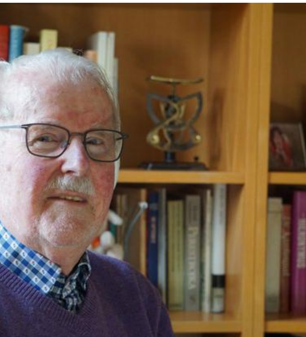
...ontwikkelingen in religie en maatschappij."

de paarden van Marrum. Iedereen kent het beeld van de groep paarden die door het water worden geleid en zo in veiligheid worden gebracht. Voor Theo is het de aanleiding om positieve kant van het negatieve begrip 'kuddegedrag' te belichten. Het doorgeschoten individualisme in onze cultuur verdringt de waarden, waarbij de groep en de verbinding centraal staan.