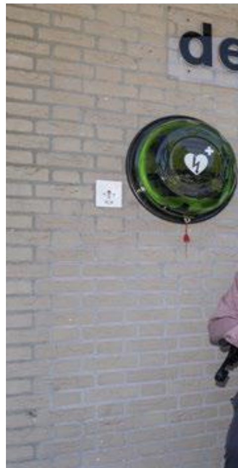
Het bestuur van Algemene Hulpdienst

Na de Tweede Wereldoorlog werd dit nog erger. Hulpbehoevenden zaten met de handen in het haar, niet wetend waar hulp te vragen. U kunt de gemeente wel bellen, maar die komt geen lamp vervangen of boodschappen doen. In 1973 werd dit in Venray (deels) ondervangen met de oprichting van de Algemene Hulpdienst (AHD). Vrijwilligers boden aan om te helpen. Het was dan altijd kortdurende hulp aan mensen die geen geld hadden voor het betalen van bedrijven of beroepsklussers. De gemeente Venray stelt daar geld voor beschikbaar. Zo draait de AHD al vijftig jaar. Elk jaar vragen enkele