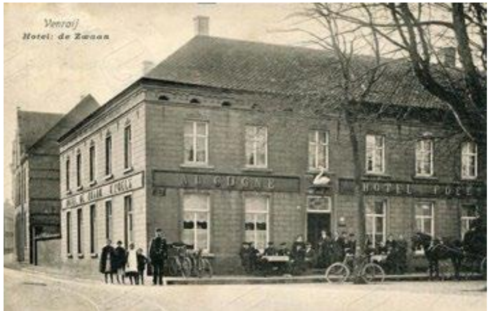
'Au Cygne' op de gevel van hotel de Zwaan: wat een allure!

Een mooie foto uit 1910 laat het hotel zien. De zwaan boven de deur. Het is een prachtig tafereel, waarin mensen poseren voor de fotograaf en tegelijkertijd zo normaal mogelijk doen. Zo vaak werden er geen foto's gemaakt. Ik zie op de foto een veldwachter met vier kinderen,