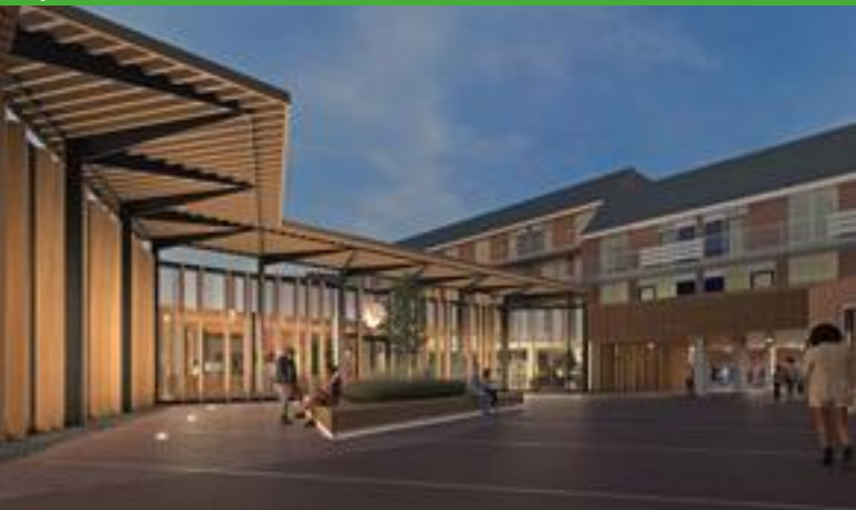
Het vooraanzicht van de nieuwe Venrayse bibliotheek

De bibliotheek verhuist van de Merseloseweg naar het Henseniusplein in Venray. Onlangs startte de grootscheepse verbouwing van het voormalige supermarktpand waar de bibliotheek wordt gevestigd.