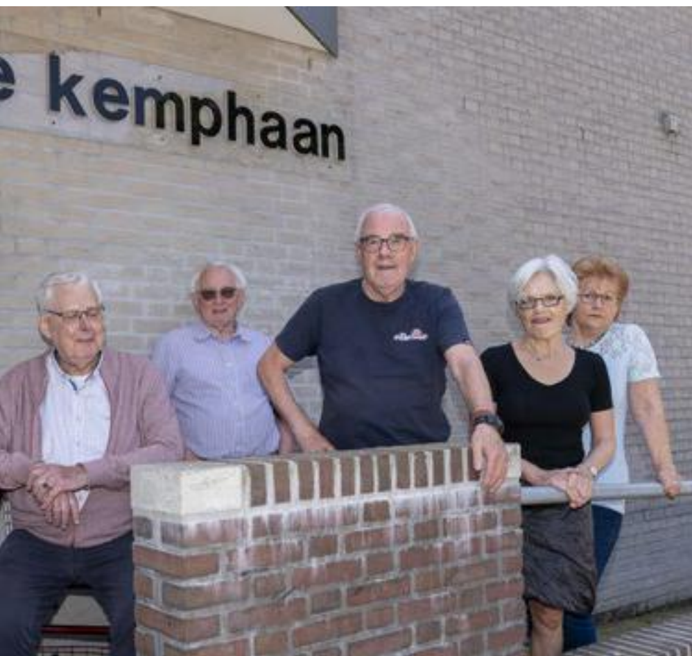
... die is gevestigd in De Kempphaan.