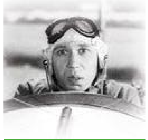
Komiek George Formby.

Op 14 mei 1926 was de Bioscoopwet in het Staatsblad geplaatst. Deze wet had tot doel de gevaren van de bioscoop op zedelijk en maatschappelijk terrein te bestrijden. Op grond hiervan konden de gemeenten waar een bioscoop