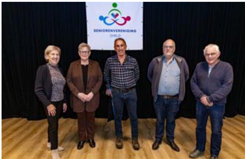
Het bestuur van Seniorenvereniging Oirlo presenteert het nieuwe logo.

Ook de senioren van Oirlo, die de naam Seniorenvereniging Oirlo heeft aangenomen, stapt over naar FASv. Voor Oirlo speelt een ander pijnpunt: "Wij doen dit ook vanwege