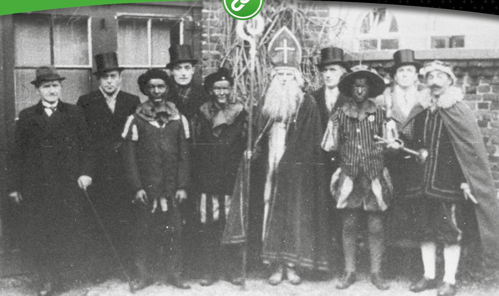
Sinterklaas in 1946, foto gemaakt op de binnenplaats van hotel De Zwaan in Venray.