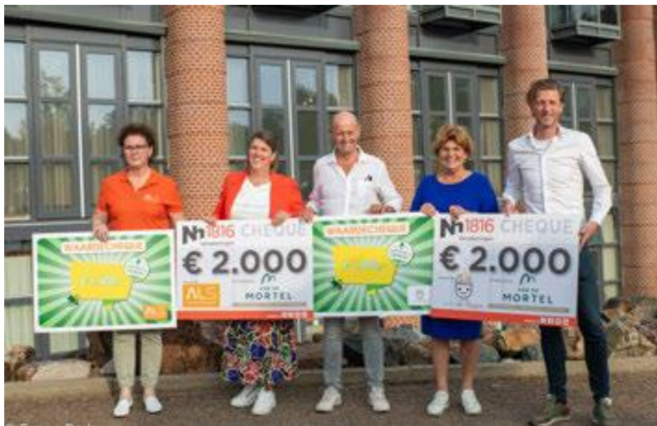
Wandelcheques voor ALS Nederland en Durf Te Vragen.

"Er hebben 2661 wandelaars deelgenomen en dat zijn bijna 800 wandelaars meer dan vorig jaar. Het wandelevenement is uniek omdat we de wandelaars de mogelijkheid geven om elke dag een andere afstand te kiezen. Je bepaalt zelf of je een, twee of drie dagen meel-