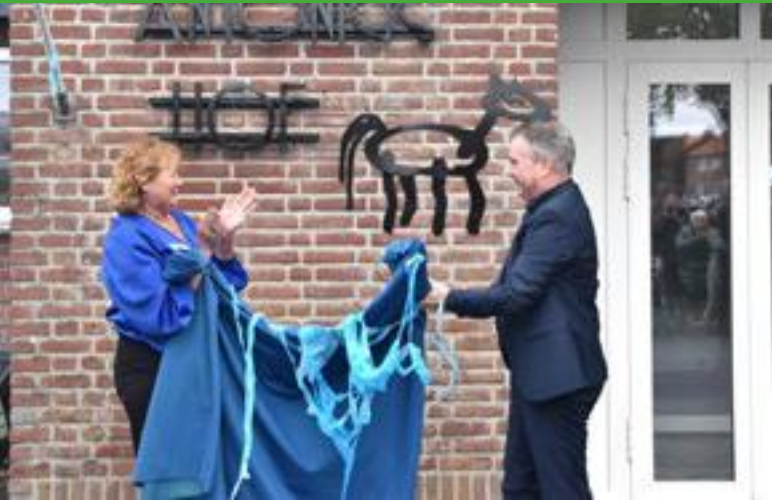
Officiële opening van Antoniushof in Veulen.