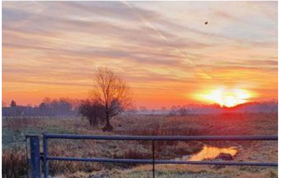
Altijd gaat de zon weer op....

Ik heb de tekst niet zelf bedacht. Het is een citaat uit een boek van Nikos Kazantzakis, 'Christus wordt weer gekruisigd'. Dacht ik... Nikos moet wel een linkse schrijver zijn geweest, anders had ik het niet gedurfd om hem te citeren. En mijn medestudenten zijn tevreden over mijn statement. Ik heb mijzelf ge-