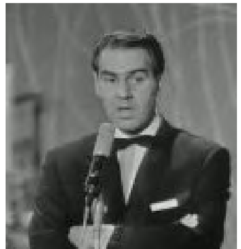
Presentator Willem Duys.

Er volgden nog enkele pogingen om het gala nieuw leven in te blazen, maar de platenbazen gaven niet thuis. Later kwam De AVRO