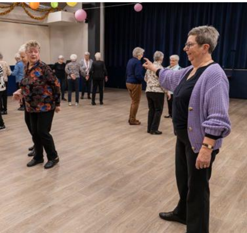
Ans en dansles voor senioren in Blitterswijk.

authentieke kringdansen te leren. Die zijn één groot belevingsmoment."