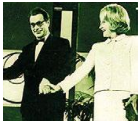
Godfried Bomans en Marlene Dietrich.

met de naar haar programmablad vernoemde Televizier-ring voor de beste televisieprogramma's.