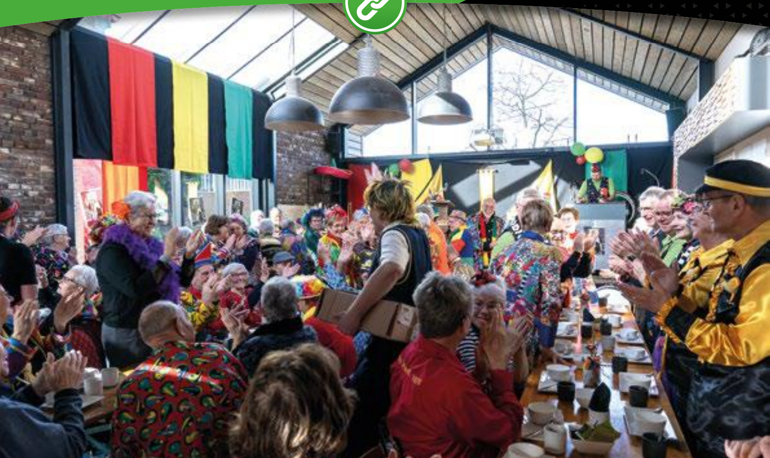
De stemming zat er goed in tijdens de carnavaleske seniorenmorgen in Geijsteren.