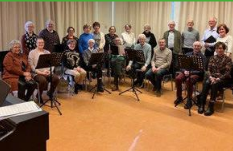
Het projectkoor Zing je Fit! is gestart.

Zing je Fit! is één van de drie proefprojecten voor alternatieve vormen van dagbesteding voor mensen met geheugenproblemen en jongdementie. De proef is een initiatief van de Kerngroep Venray Dementievriendelijk en de gemeente Venray, die hiervoor financiële middelen van het Rijk beschikbaar heeft gesteld.