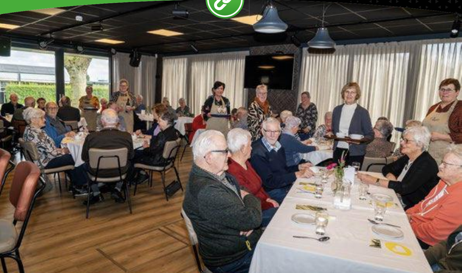
Vrijwilligers serveerden een viergangenmenu in gemeenschapshuis De Linde in Oirlo.