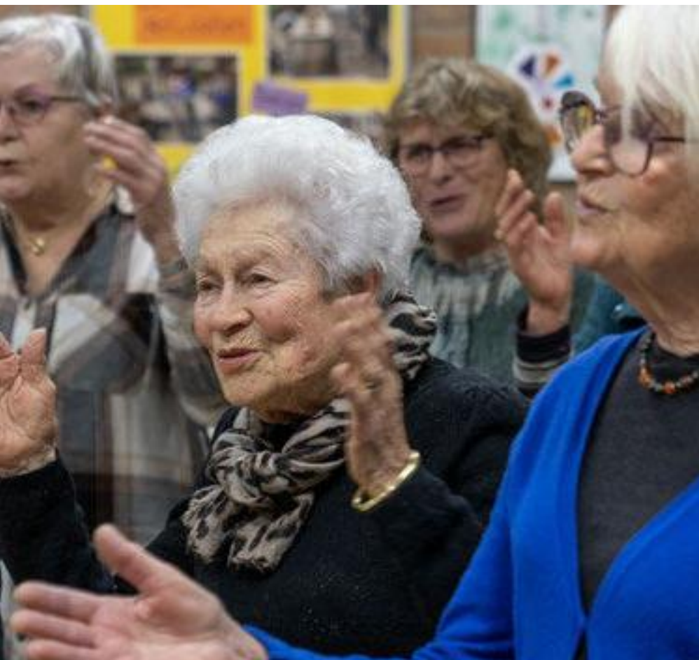
dkoor A Djambo.

ne. Toen hij werd uitgezonden naar Nieuw-Guinea mocht Floor met het jonge gezin niet mee om redenen van veiligheid. "Dat vond ik heel erg jammer. Ik had wel zin in de tropen!", vertelt Floor. Ze had graag dat avontuur beleefd..