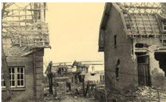
Foto van de Maasheseweg, direct na de bevrijding.