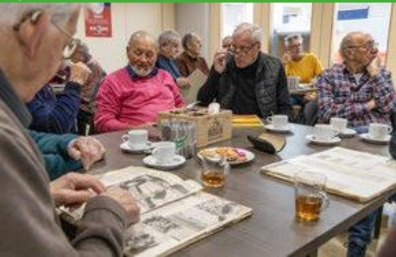
De SV Venray-plakboeken komen op tafel..

Bij SV Venray vindt sinds het seizoen 22/23 twee keer per jaar een ochtend plaats onder de noemer Football memories. Tijdens deze ochtenden kunnen de aanwezigen aan de hand van plakboeken, foto's, filmpjes en verhalen herinneringen ophalen aan de rijke historie van de voetbalclub. Maar bovenal is het een ochtend vol gesprekken, humor en gezelligheid.