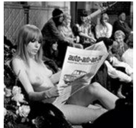
Hoepla: twee blote borsten.

Een detective-serie in de jaren '60 springt er nog steeds uit. De in Engeland spelende serie De Wrekers , met Patrick Macnee als John Steed (uitgerust met de Britse bolhoed en paraplu) en Diana Rigg als Emma Peele. Beide geheimagenten waren op elkaar ingespeeld en brachten de typische, zeer onderkoelde humor van de Britten. The Avengers was de Britse benaming van de serie, die zijn oorsprong vindt in Police Surgeon van 1960. De serie heeft een laconieke en stoïcijnse ondertoon, heel wat anders dan de politseries van nu. Deze moeten het vaak hebben van veel geweld, waarbij spectaculaire ongevallen worden getoond en dusdanig geschoten wordt, dat ouders zich wel eens afvragen of dit wel goed is voor de kinderen. Steed en (vanaf 1965) Peele deden dit veel subtieler. Er werd soms gevochten, maar