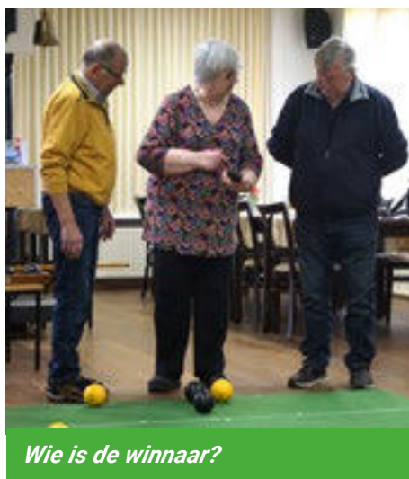
Wie is de winnaar?

regelen: regels zijn immers regels. Dat hoort ook zo en er is ook nooit discussie over. Er zijn nu twaalf mensen lid van deze club, maar er worden nog twee nieuwe leden gezocht. Veertien is het maximum. Dan is het een mooie groep en hoef je niet te lang op je beurt te wachten.