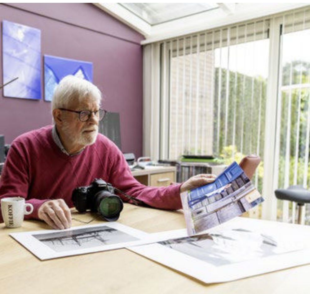
keke van zijn foto's: "Ik kan me helemaal in fotografie verliezen."

de camera op de grond legde om vanuit die positie een foto te maken. Dat leverde een bijzonder mooi beeld op. Ja, toen was opa natuurlijk erg trots."