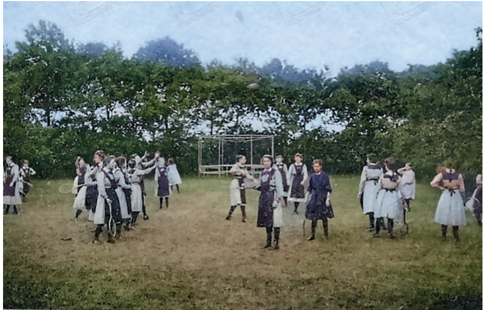
De pubermeisjes van Jerusalem.

Odapark. Een zandheuvel met sparren en dennen veranderde rond 1900 in een park, het Odapark. De Ursulinen bewoonden een groot klooster op de plaats waar nu het gemeentehuis staat en beheerden een school, Jerusalem. En een internaat voor meisjes. Deze zandheuvel werd gekocht door de Ursulinen, bedoeld als buitenverblijf voor de meisjes van de kostschool. De prior of prière, Mère Felicité, liet hier in dit bos, struiken en uitheemse boomsoorten planten. Er werden paden aangelegd en prieeltjes gebouwd.