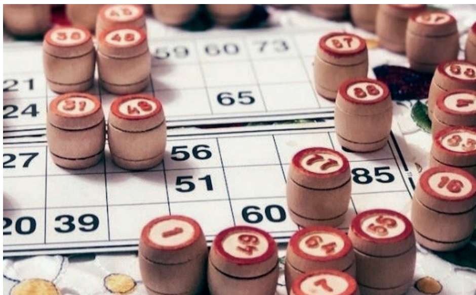
Kienen is een eeuwenoud spel, maar nog altijd enorm populair.

Van oudsher ging het er dus om, de vijf opeenvolgende nummers het eerste afgekruist te hebben.