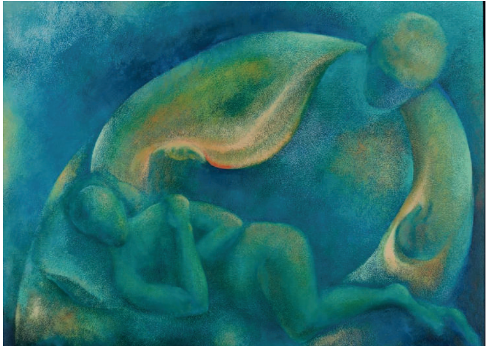
Schilderij 'Warme deken' van Jacques Kruunenberg.

Het is een inspirerende variatie aan kunst. Er zijn mooie iconen te zien: variërend van Koptische en Romeense tot Ethiopische. Ook Bijbelse vertellingen komen aan bod, bijvoorbeeld over de opstanding.