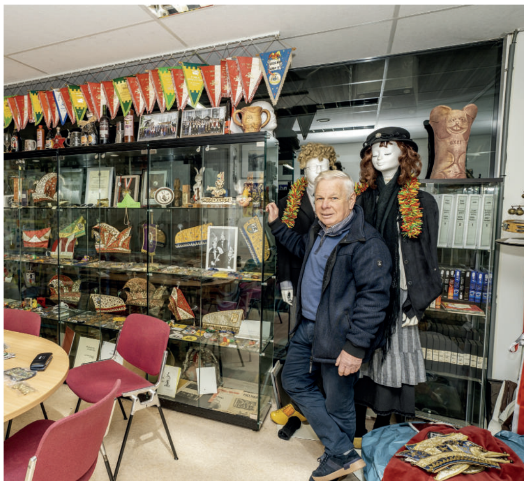
Piëlhaas in de Venrayse vastelaoveshal.