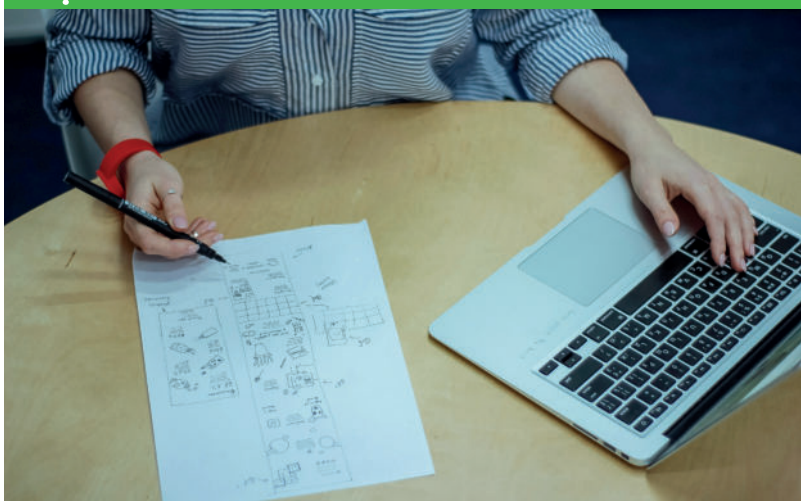
De Schakel is op zoek naar een nieuwe secretaris.