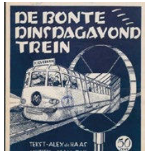
De Bonte Dinsdagavondtrein.