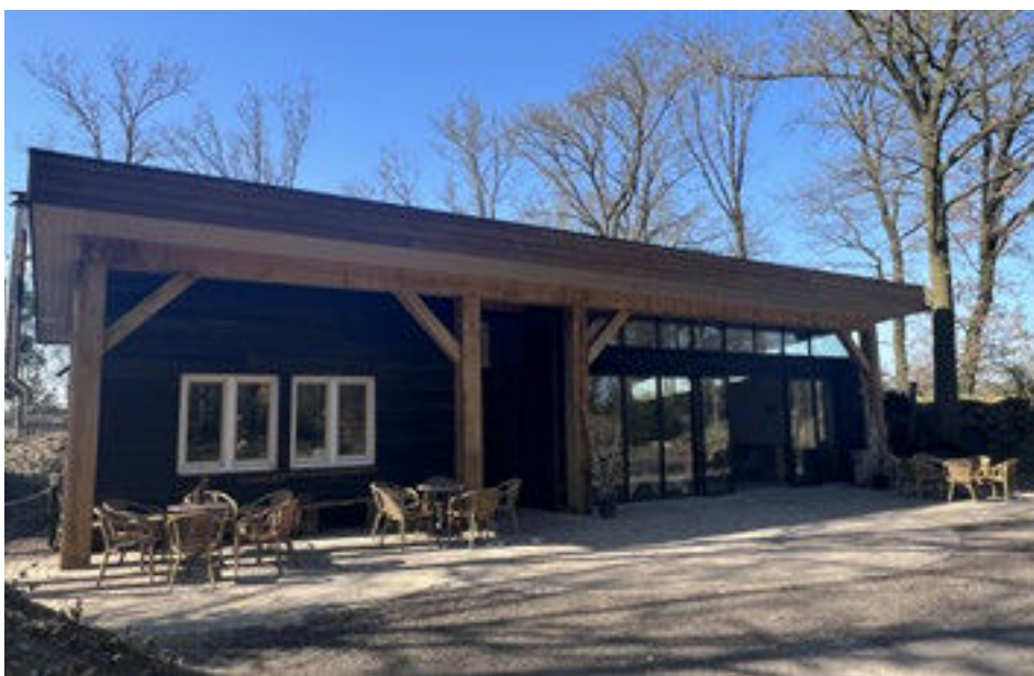
Het nieuwe Boshuis op natuurbegraafplaats Weverslo.

In het Boshuis kunnen mensen in alle intimiteit en geborgenheid hun eigen afscheid helemaal naar eigen