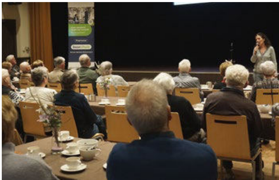
Ruime belangstelling in De Baank voor 'Senioren zelf aan zet!'

De aanwezigen werd duidelijk gemaakt dat het met de vergrijzing in Leunen, Heide en Veulen heel hard gaat. Er dreigt onvoldoende geschikte woonruimte en de zorg neemt af door toenemend personeelsgebrek. Ook het aantal beschikbare mantelzorgers zal sterk