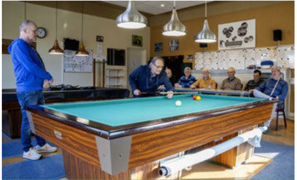
Iedereen, ervaren of niet, kan biljarten bij De Kemphaan.

De leden kunnen iedere dag tussen 09.00 uur en 17.00 uur terecht om hun sport te beoefenen. Natuurlijk is het sportieve element van belang, maar gezelligheid en onderling respect zijn minstens zo belangrijk en dat wordt door de vereniging gepropageerd.