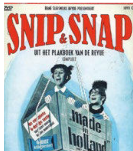
Snip en Snap.

Een dergelijk duo is een klassieker. Mensen kenden het stramien al van 'de Dikke en de Dunne-films', waarmee Oliver Hardy en Sten Laurel volle bioscoopzalen trokken: de dikke die alles serieus goed wil doen en de dunne die alles ver-