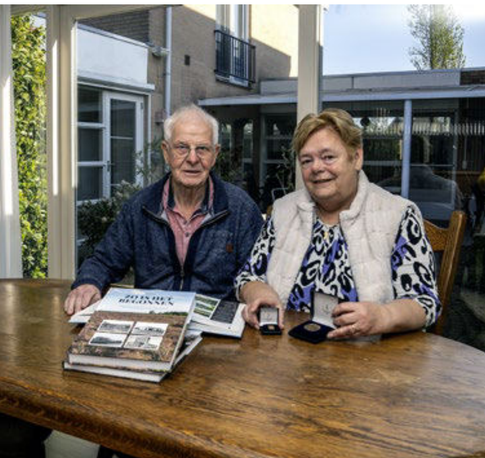
Boeken 'Zo is het begonnen' deel 1 en 2 en de bronzen waarderingspenning.

jaar als seniorenvereniging nog uitgenodigd op het muziekfestival Jera On Air, waar we van een aantal bestuursleden een rondleiding kregen." Met een lach: "Een aantal van onze leden heeft zich daarna aangemeld als vrijwilliger voor het festival, waar ze altijd mensen voor allerlei klusjes kunnen gebruiken. Ook senioren! Het is prachtig dat Ysselsteyn zo'n muziekfestijn, mede dankzij de inzet van al die vrijwilligers, kan organiseren."