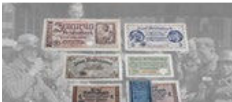
Enkele originele 'Schein'.

De Blaktbewoners vertrokken naar Molenhoek (tussen Oirlo en Castenray), waar ze onderdak vonden. De volgende ochtend stonden vijf Duitsers aan de deur. 'Ze moesten en zouden paarden hebben. Gelukkig bleken ze ontzag te hebben voor de