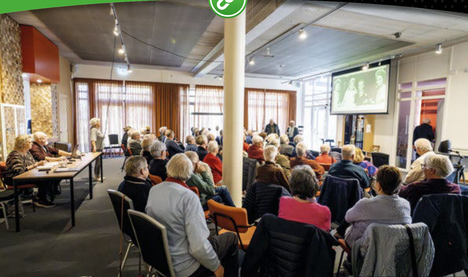
Gezellige drukte bij de fotokijk- en beschrijfmiddag in het Venrays Museum.