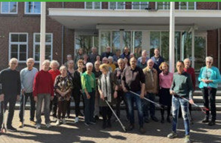
Zwerfafvalvrijwilligers in het zonnetje.

Vrijwilligers die zich inzetten voor een schoner Venray zijn begin april door de gemeente Venray in het zonnetje gezet.