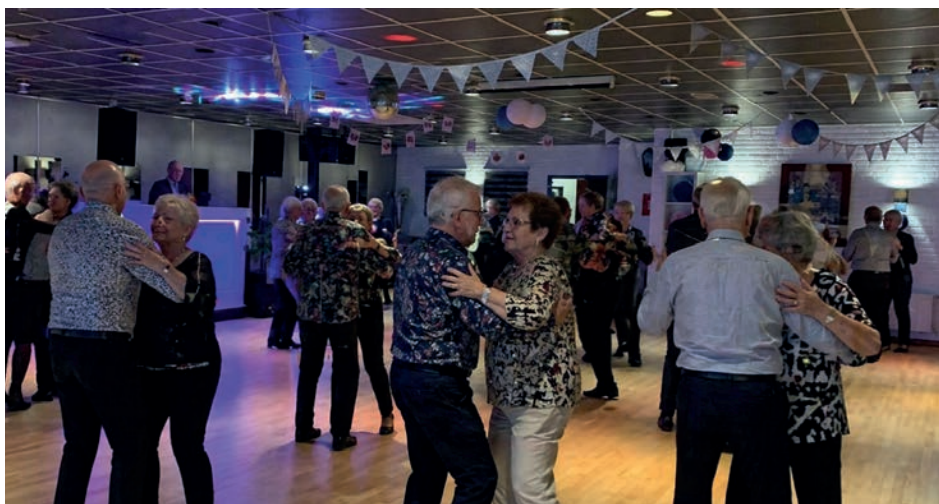
Een impressie van een 50+ dansmiddag.

Tijdens de dansmiddagen klinken bekende melodieën waarop gemakkelijk gedanst kan worden. Foxtrot, Engelse wals, tango en andere herkenbare dansen zorgen ervoor dat veel bezoekers al snel de vloer op gaan. Ervaring is daarbij helemaal niet nodig. Ook mensen die jarenlang niet meer hebben gedanst, blijken het vaak verrassend snel weer op te pakken.