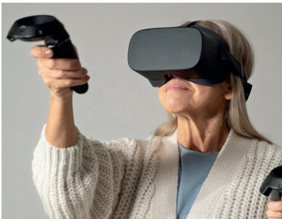
De workshop laat deelnemers letterlijk anders kijken naar dementie.

De deelnemers volgen een interactief programma van ongeveer een kwartier. Daarbij ervaren zij situaties uit het dagelijks leven, zoals boodschappen doen of het bedienen van een radio. Juist die gewone momenten blijken voor iemand met dementie vaak ingewikkeld of