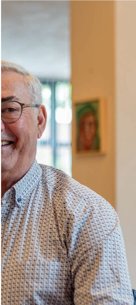
Horst-Venray.