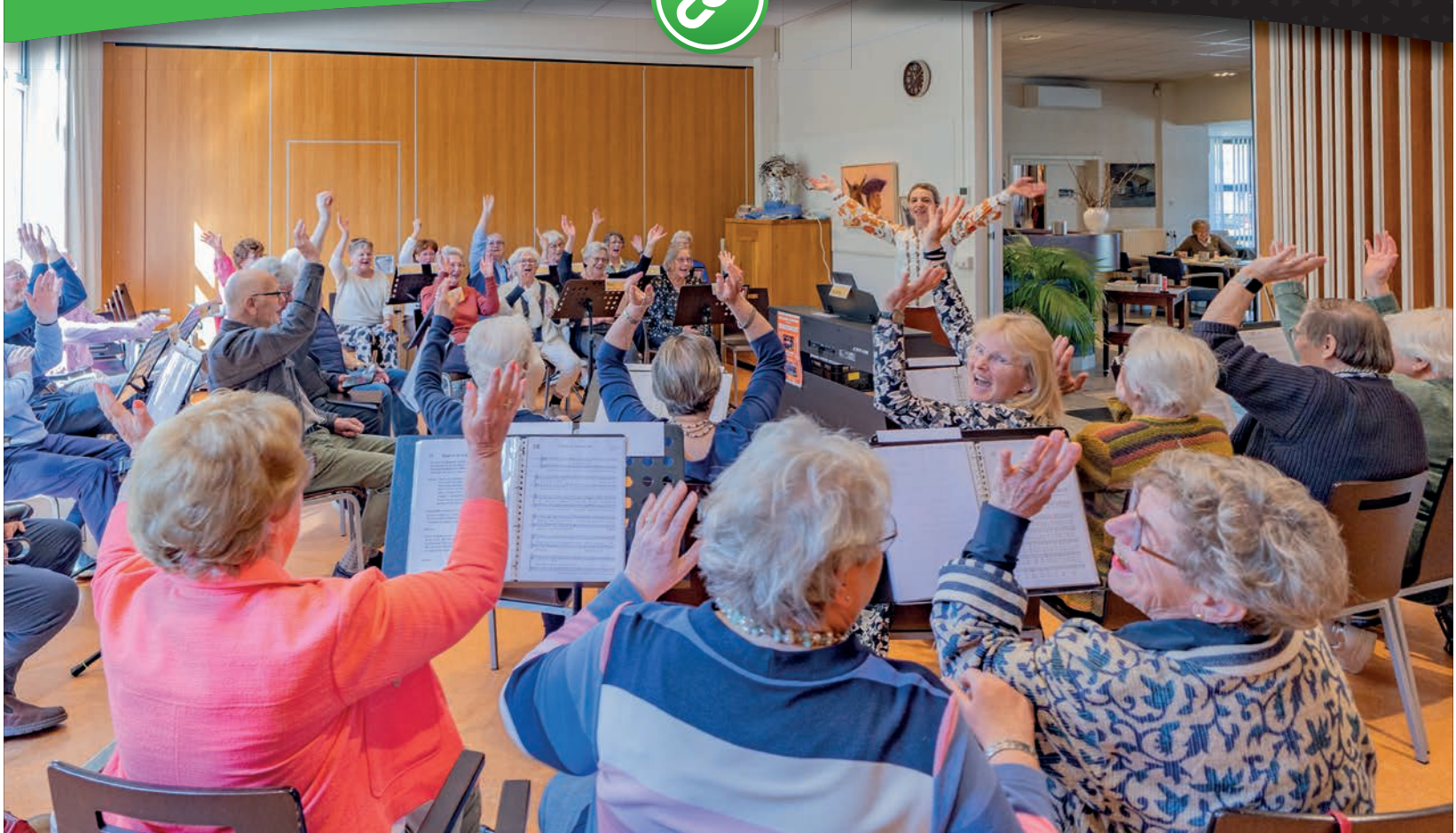
De sfeer zat er goed in bij de repetitie van het Zing Je Fit koor.